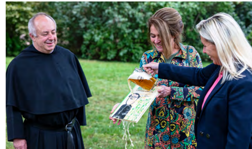
— Zahájení oslav Mendelu a křest knižky.