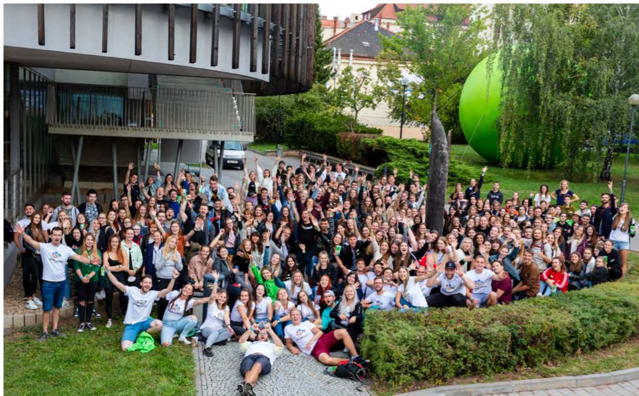
— Prvákoviny — Ceny rektora Mendelovy univerzity

Co nás již v novém akademickém roce potkalo a co nás ještě čeká?